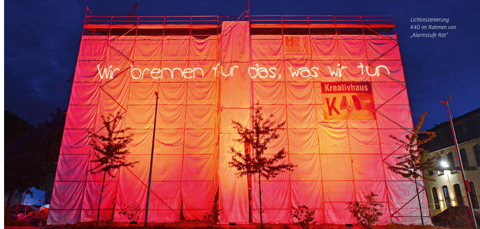
Lichtinszenierung K40 im Rahmen von „Alarmstufe Rot“