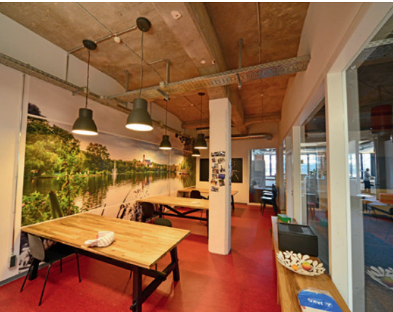
Beide Bilder: Mieteinheit pentacor GmbH K40 / Etage 2