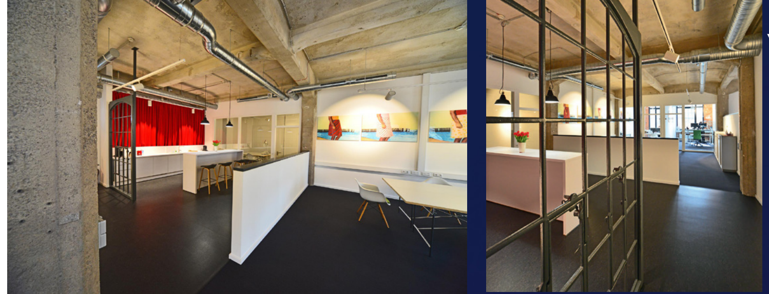
Bilder oben: Mieteinheit Peppermint Holding GmbH, K40 / Etage 1

Das um 1913 errichtete Gebäude 40, in dem zu DDR-Zeiten die Endfertigung sowie die Lehrlingsausbildung der Webstuhlfabrik untergebracht waren, steht zurzeit im Fokus. Mit 6.000 m 2 Gesamtfläche auf 4 Etagen inkl. Keller, davon ca. 4.000 m 2 Mietfläche, ist das Kreativhaus K40 der bisher größte Bauabschnitt auf dem Gelände der schönherr.fabrik. Im Herbst 2019 begannen die Baumaßnahmen und mittlerweile sind drei Etagen komplett vermietet. Davon sind zwei Etagen schon saniert und bezogen. Das Dachgeschoss soll bis Ende 2022 fertig gestellt werden. Die Sanierung trägt diesmal eine ganz andere Handschrift – eben kreativ und bunt: Im Inneren soll der industrielle Charakter erhalten bleiben. Die Decken bleiben roh, Kabel und Leitungen werden offen verlegt, die gusseisernen Fenster erhalten, das Mauerwerk wird sandgestrahlt und bleibt sichtbar. Die Farben rot, grün, orange und blau finden sich auf den verschiedenen Etagen wieder und mit