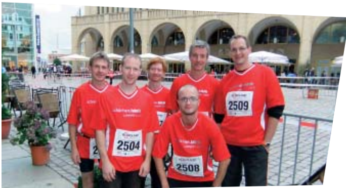
Das Team der schönherr.fabrik zum 5. Chemnitzer Firmenlauf