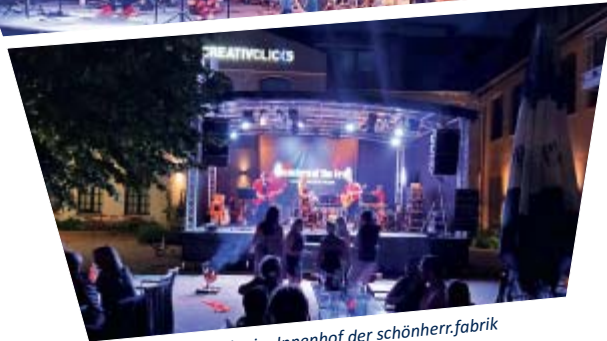
Inventors Of The Fire im Innenhof der schönherr.fabrik

Im Rahmen unserer RETTET-DIE-KNEIPEN-Tour machten die Organisatoren und die Band „Inventors of The Fire“ Station im Restaurant »max louis« und sorgten dort gemeinsam mit dem Team von tec4You für super Klang und Stimmung. Neben dem köstlichen Essen, zahlreichen Getränken und einem Liveprogramm aus Rock- und Unterhaltungsmusik, wartete zu späterer Stunde eine Lasershow von tec4You auf die Gäste! Natürlich feierten alle unter den gegebenen Abstands- und Hygienegeboten.