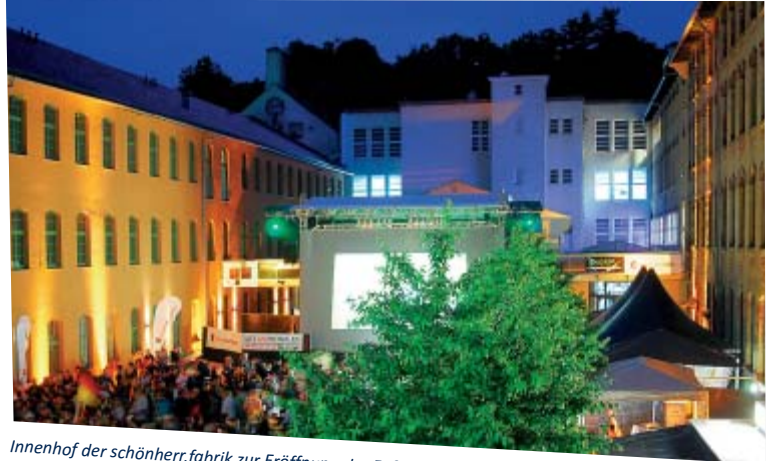
Innenhof der schönherr.fabrik zur Eröffnung der Fußball-WM im Jahr 2010

Zwischen den fußballverrückten Tagen wurde dem in Chemnitz so langersehnten Sommerkino neues Leben eingehaucht. Filme aus allen Epochen der Filmgeschichte und aktuelle Kinohits ließen laue Sommerabende bei einem guten Glas Wein zu einem einzigartigen Erlebnis werden.