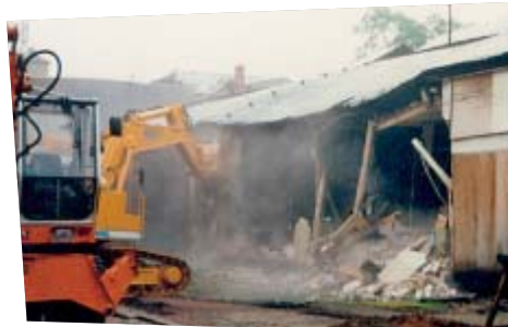
Abriss von maroden Gebäuden